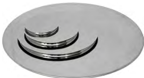
Крышки диаметром 120, 200, 300 и 500 мм