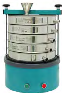
Грохот ГР 30