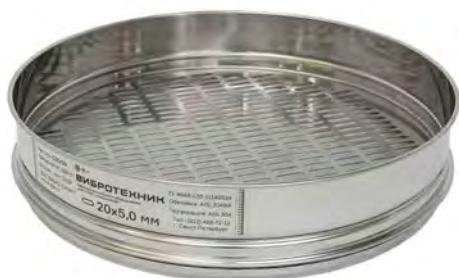
Сито С 30/50 с продолговатыми отверстиями