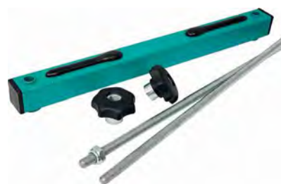
Устройство крепления сит УКС