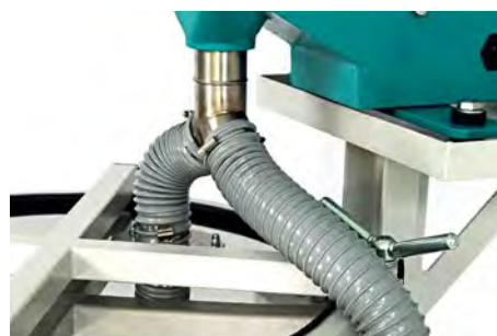
Грохот ГР 50 удвоенной производительности с одновременной загрузкой на 2 сита