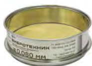
Сито С 12/38 с сеткой из латуни