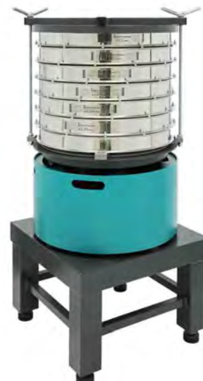
Анализатор А 50 на базе ВП 50 на Тумбе Т 40