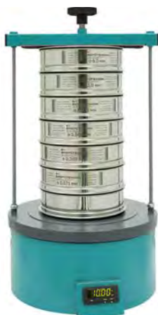
Анализатор А 20 на базе ВП 30Т