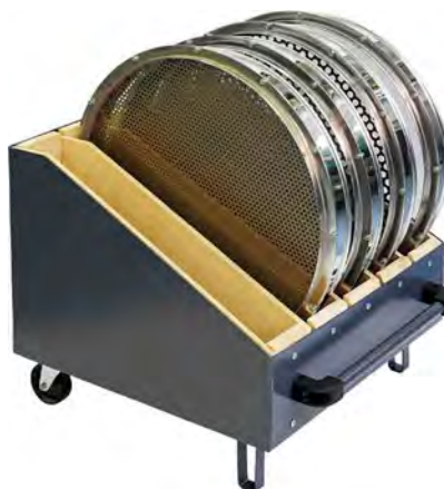
Кассета для сит С 50/70 и сит ГР 50