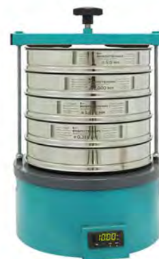
Анализатор А 30 на базе ВП 30Т