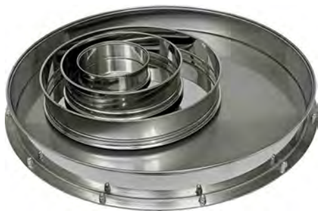
Поддоны диаметром 120, 200, 300 и 500 мм

Поддон грохота предназначен для непрерывной разгрузки в приемную емкость материала, прошедшего через нижнее сито.