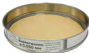
Сито С 20/38 с сеткой из бронзы