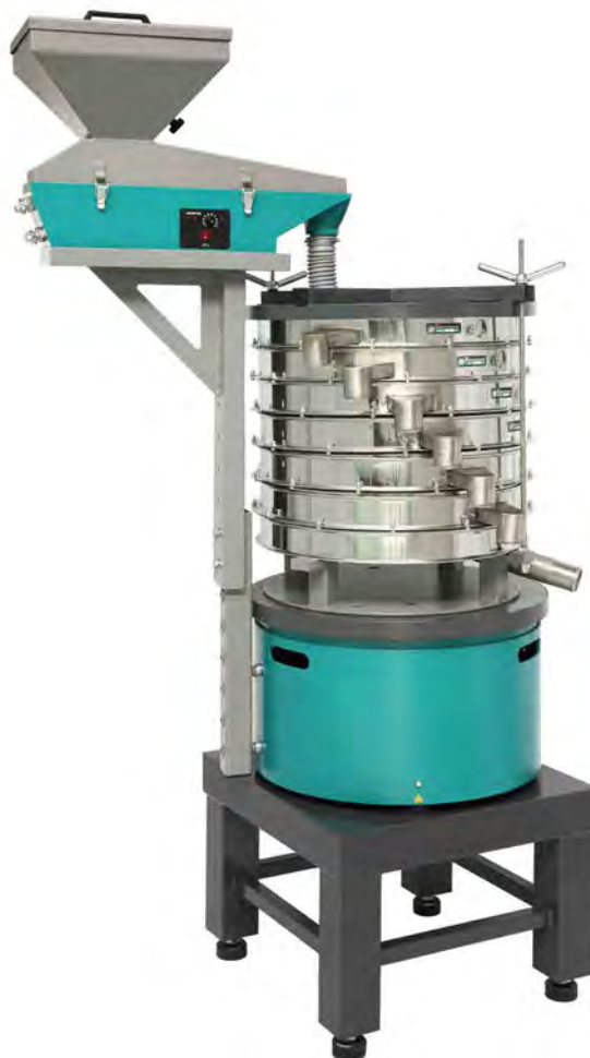
Агрегат рассеивающий на базе ГР 50 с Питателем ПГ 1