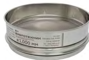
Сито контрольной точности С 20/50К с сеткой из нержавеющей стали