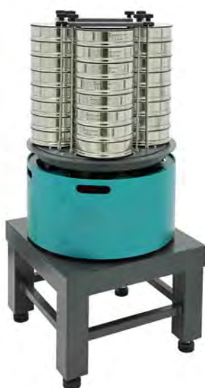
Анализатор А 20x4 на базе ВП 50 на Тумбе Т 40