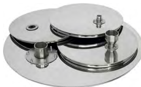
Крышки ГР 30 с мембраной, патрубком и воронкой Крышка ГР 50 с патрубком