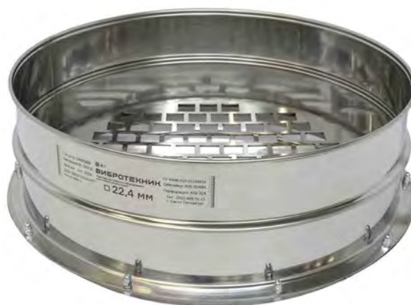
Сито С 40/140 с квадратной перфорацией