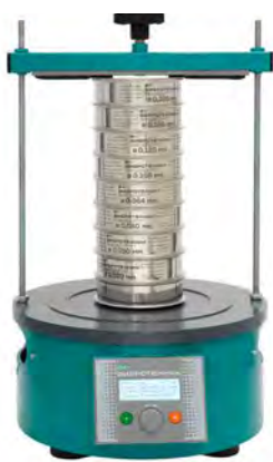
Анализатор А 12 на базе ВПС