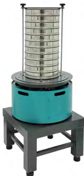
Анализатор А 30 на базе ВП 50 на Тумбе Т 40