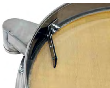
Патрубок и отбойник сита ГР 50