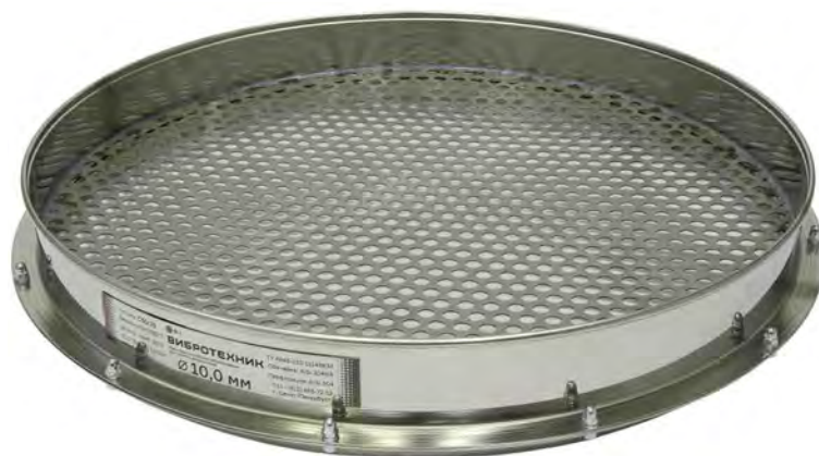
Сито С 50/70 с круглой перфорацией