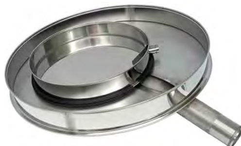
Поддоны Грохота ГР 30 и ГР 50