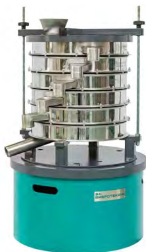
Грохот ГР 40